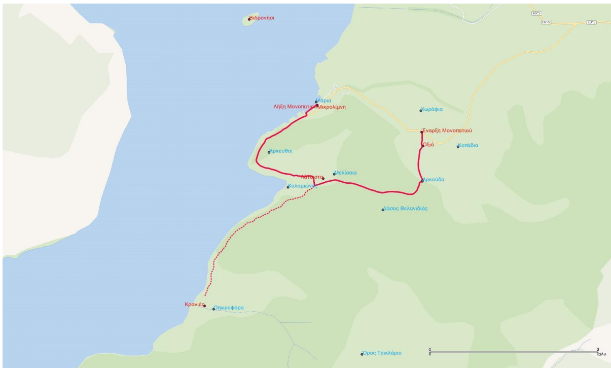
Εικόνα 12: Ο χάρτης του Μονοπατιού της Συνύπαρξης στο Εθνικό Πάρκο Πρεσπών, έτσι όπως διαμορφώθηκε για την αποστολή για γραφιστική επιμέλεια

Στα παραρτήματα (I έως VII) μπορείτε να δείτε τα κείμενα έτσι όπως παραδόθηκαν στις 15/08/2021, και με κάποιες μικρές βελτιώσεις όπως ήταν αναγκαίο για να μπορέσουν να έχουν ομοιόμορφη παρουσίαση στα έντυπα που δημιουργήθηκαν και για τα δύο Εθνικά Πάρκα.