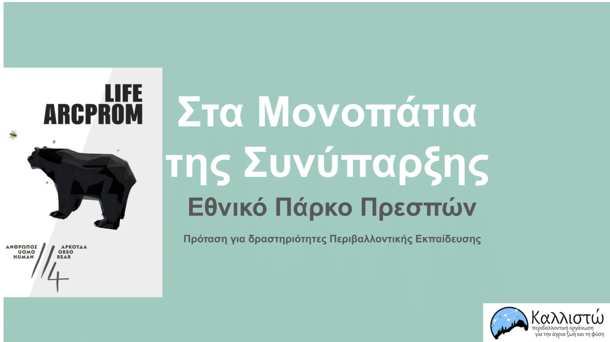
Εικόνα 2: Παρουσίαση του εκπαιδευτικού υλικού στα Μονοπάτια της Συνύπαρξης στο Εθνικό Πάρκο Πρεσπών

Την παρουσίαση αυτή ακολούθησε συζήτηση όπου η συμμετοχή ήταν ιδιαίτερα θερμή κάτι που βοήθησε ιδιαίτερα στην αναδιαμόρφωση του υλικού.