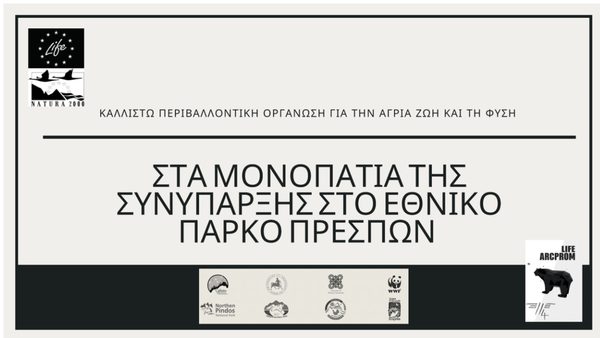
Εικόνα 5: Παρουσίαση αποτελεσμάτων εκδήλωσης διαβούλευσης.

Στις 11/10/2021 στάλθηκε σε όσους και όσες συμμετείχαν στην εκδήλωση διαβούλευσης η πορεία της δράσης ώστε να μπορούν να αξιολογήσουν την εξέλιξη της δράσης αλλά και του εκπαιδευτικού υλικού.