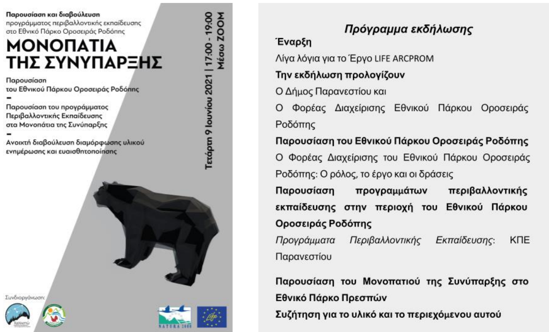
Εικόνα 6: Πρόσκληση και πρόγραμμα εκδήλωσης διαβούλευσης για το Μονοπάτι της Συνύπαρξης στο Εθνικό Πάρκο Οροσειράς Ροδόπης

Η εκδήλωση διαβούλευσης πραγματοποιήθηκε διαδικτυακά στις 9/06/2021. Την εκδήλωση χαιρέτησαν ο Δήμος Παρανεστίου και ο Φορέας Διαχείρισης Οροσειράς Ροδόπης. Η εκδήλωση συνέχισε με την παρουσίαση των Δράσεων Ενημέρωσης και Ευαισθητοποίησης του Φορέα Διαχείρισης Οροσειράς Ροδόπης καθώς και την παρουσίαση των προγραμμάτων Περιβαλλοντικής Εκπαίδευσης που κάνει στην περιοχή το Κέντρο Περιβαλλοντικής Εκπαίδευσης Παρανεστίου. Ακολούθησε η παρουσίαση της πρότασης περιβαλλοντικών δραστηριοτήτων του Έργου με τίτλο “Μονοπάτι της Συνύπαρξης στο Εθνικό Πάρκο Οροσειράς Ροδόπης”.