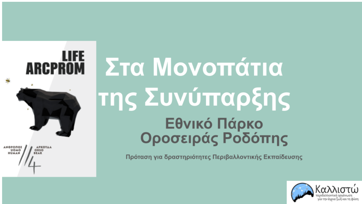
Εικόνα 7: Παρουσίαση του εκπαιδευτικού υλικού στα Μονοπάτια της Συνύπαρξης στο Εθνικό Πάρκο Οροσειράς Ροδόπης

Την παρουσίαση αυτή ακολούθησε συζήτηση όπου η συμμετοχή ήταν ιδιαίτερα θερμή κάτι που βοήθησε ιδιαίτερα στην αναδιαμόρφωση του υλικού.