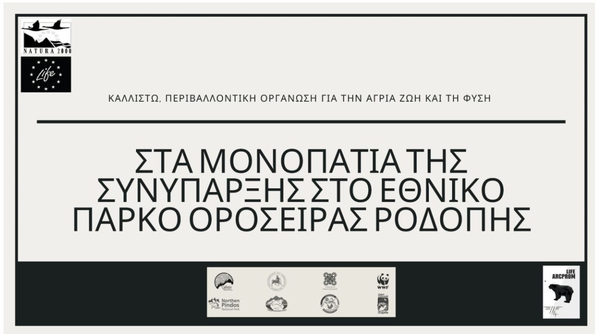
Εικόνα 10: Παρουσίαση αποτελεσμάτων εκδήλωσης διαβούλευσης.

Στις 11/10/2021 στάλθηκε σε όσους και όσες συμμετείχαν στην εκδήλωση διαβούλευσης η πορεία της δράσης ώστε να μπορούν να αξιολογήσουν την εξέλιξη της δράσης αλλά και του εκπαιδευτικού υλικού.