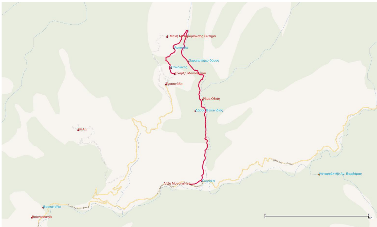
Εικόνα 13: Ο χάρτης του Μονοπατιού της Συνύπαρξης στο Εθνικό Πάρκο Οροσειράς Ροδόπης, συγκεκριμένα στη διαδρομή από τον οικισμό της Πρασινάδα, έτσι όπως διαμορφώθηκε για την αποστολή για γραφιστική επιμέλεια

δραστηριοτήτων, επιπλέον υλικό από τους Φορείς Διαχείρισης, οδηγοί παρατήρησης πουλιών, κιάλια, μεζούρες, αντικείμενα από τις περιοχές, ενημερωτικό υλικό από τοπικές οργανώσεις και φορείς, υλικό από τους Δήμους των δύο περιοχών κ.ο.κ.