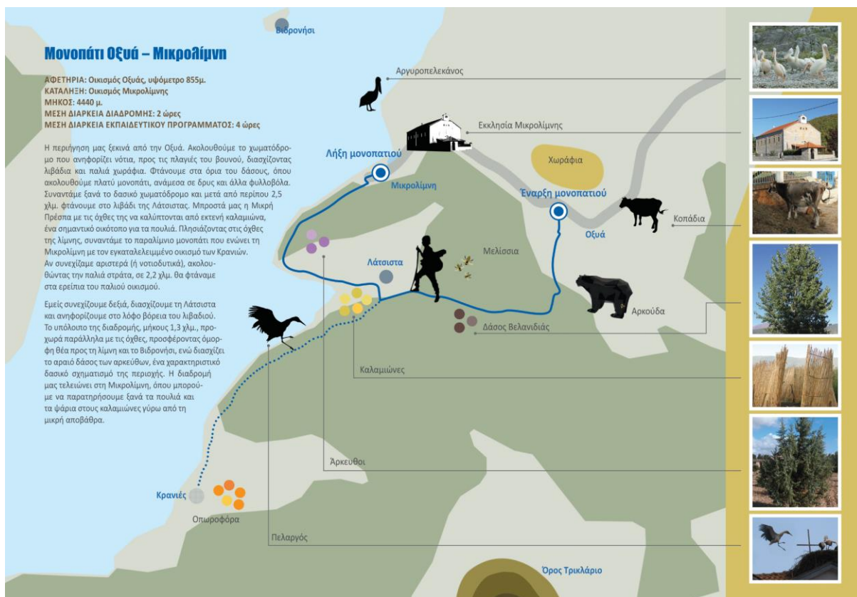
Εικόνα 11: Μέρος του υλικού από το φυλλάδιο μαθητών και επισκεπτών του Εθνικού Πάρκου Πρεσπών

Μετά τη λήξη των διαβουλεύσεων άμεσα έγινε και η αναδιαμόρφωση του υλικού βάση των σχολίων και προτάσεων που παρουσιάστηκαν από τους συμμετέχοντες και τις συμμετέχουσες. Βάση του υλικού που παράχθηκε στην προηγούμενη φάση της δράσης αλλά και της βιβλιογραφίας δημιουργήθηκε το τελικό υλικό έως και τις 15/08/2021 όπου και παραδόθηκε. Μετά την παράδοση του υλικού είχαμε σταθερή επικοινωνία τόσο με το Πανεπιστήμιο Μακεδονίας όσο και με τη γραφίστρια που ανέλαβε την επιμέλεια προκειμένου να ολοκληρωθεί το υλικό. Τον Οκτώβριο η επεξεργασία του υλικού ολοκληρώθηκε και έγινε η παραγωγή του.